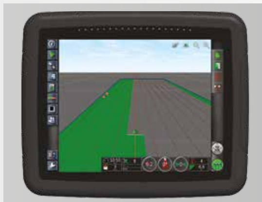
Оptionальный терминал S3000